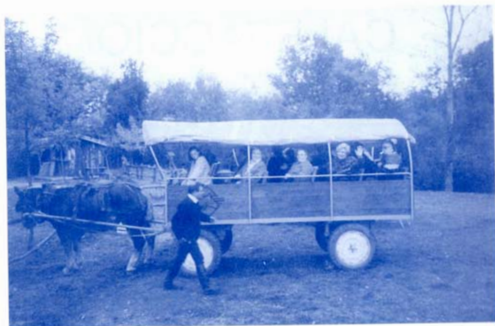
Excursió a Olot. Visita de la Fageda d'en Jordà. 28-10-1990.

Pza. Vila, 5 / 08930 SANT ADRIÀ DE BESÒS (Barcelona) Tel.: (93) 462 03 14 / Fax: (93) 462 01 69