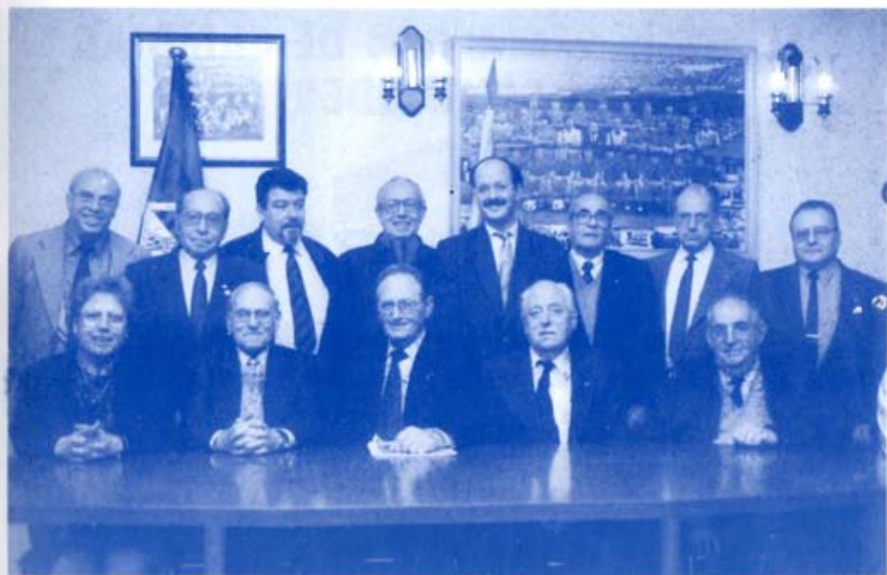
Junta directiva de la Penya Barcelonista de Sant Adrià de Besòs.

Bogatell, 28 • Telèfon 381 11 69 • Sant Adrià de Besòs (Barcelona)