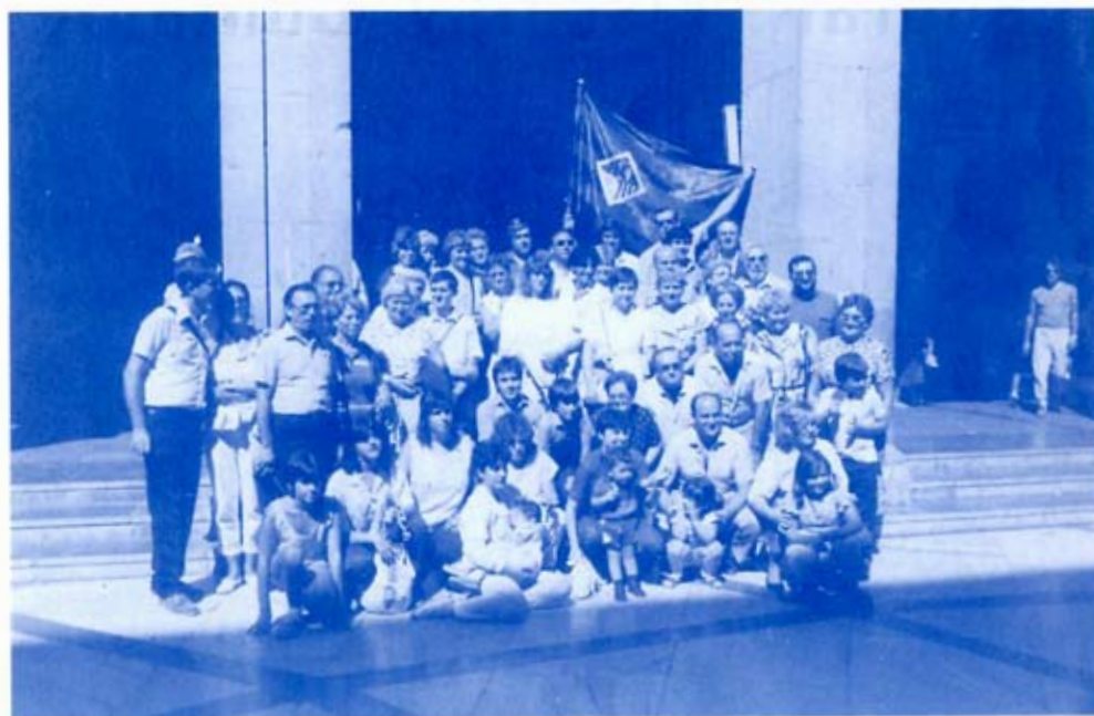
1a. excursió, 29-9-85. Benedicció de la bandera a Montserrat.

Ctra. de Mataró, 74 A Tel./Fax 381 58 05 08930 Sant Adrià de Besòs