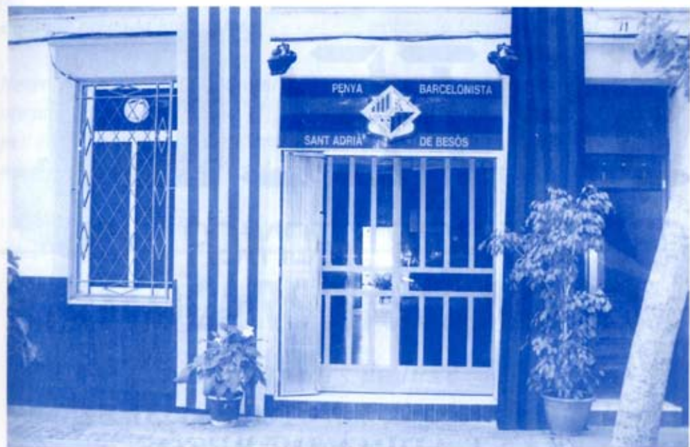
Façana d'entrada al local de la Penya Barcelonista de Sant Adrià de Besòs.