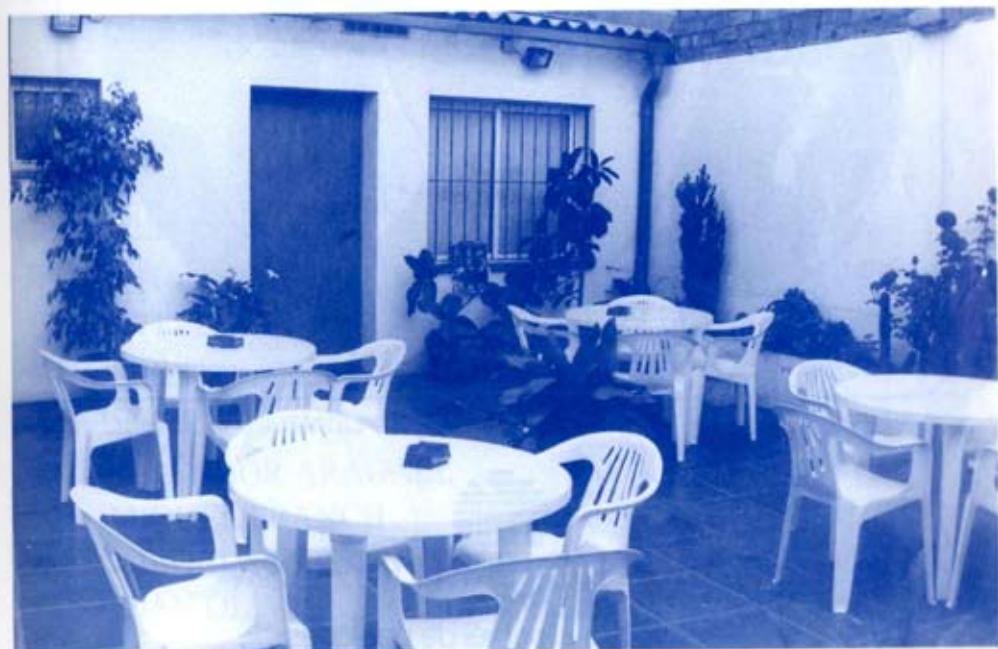
Pati del local de la Penya.

Avda. Catalunya, 7 Telf. 381 70 95 - Sant Adrià de Besòs